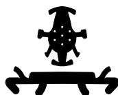
WPA00002 VERVANGING BINNENWERK