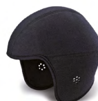
UPA00001 WINTER BINNENWERK