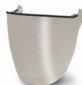
WV100003 VIZIER FULL FACE