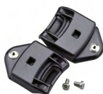
WAC00003 ADAPTER MET BAYONET