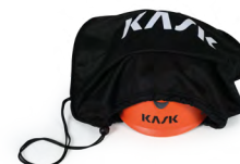
UAC00002 HELM TAS